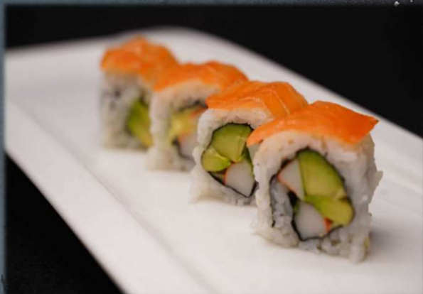
U. CALIFORNIA SPECIAL €6.00 Surimi, avocado, mayo, salmone affumicato.