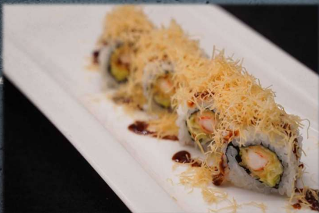
U. EBITEN €4.00 Gambero in tempura, insalata, mayo, salsa eel e pasta kataifi.