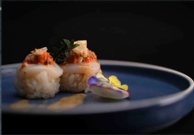
N. HOTATE SPECIAL €6.00 Nigiri di capesante a mano libera dello chef. Allergeni: 2,7,9,11,14