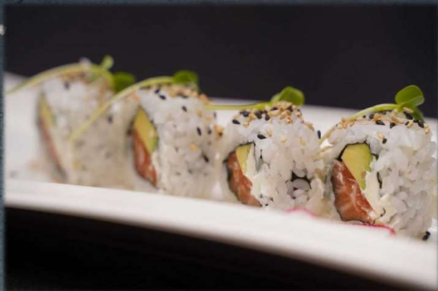
U. SALMONE AVOCADO €4.00 Salmone, avocado, philadelphia, sesamo.