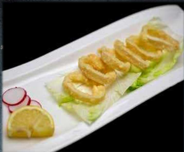
IKA NO €8.00 Anelli di calamari fritti. Allergeni: 2,7