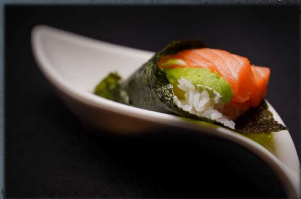
TEMAKI SAKE €5.00 Salmone, avocado e philadelphia. Allergeni: 5,9