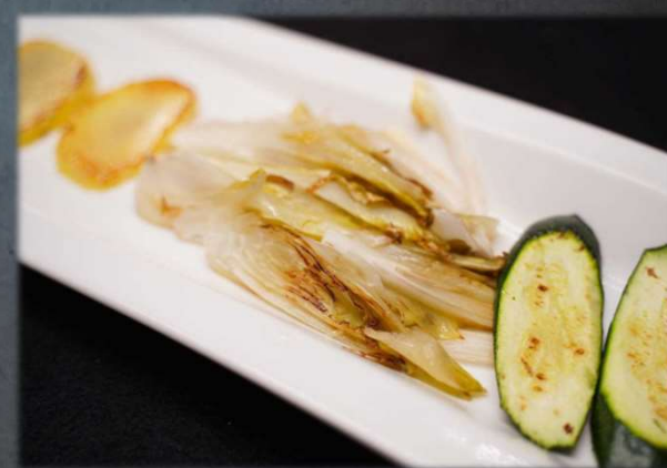
YASAI YAKI €12.00 Verdure di stagione alla griglia. Allergeni: 16