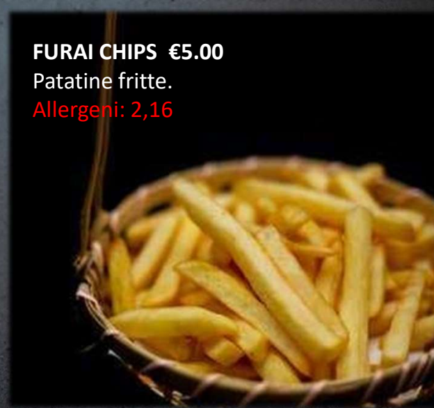
FURAI CHIPS €5.00 Patatine fritte. Allergeni: 2,16