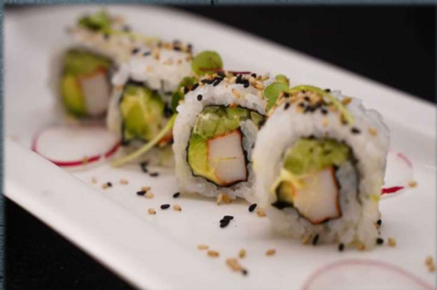
U. CALIFORNIA €4.00 Surimi, cetriolo, mayo, avocado sesamo e daikon cress.