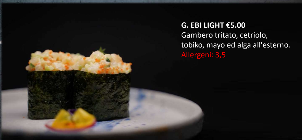
G. EBI LIGHT €5.00 Gambero tritato, cetriolo, tobiko, mayo ed alga all'esterno. Allergeni: 3,5