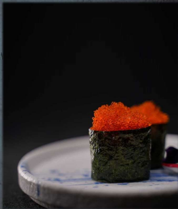
G. TOBIKKO €5.00 Uova di pesce volante ed alga all'esterno. Allergeni: 9,14