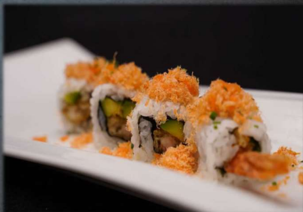
U. EBITEN PLUS €6.00 Gambero in tempura, avocado, salmone speziato ed erba cipollina.