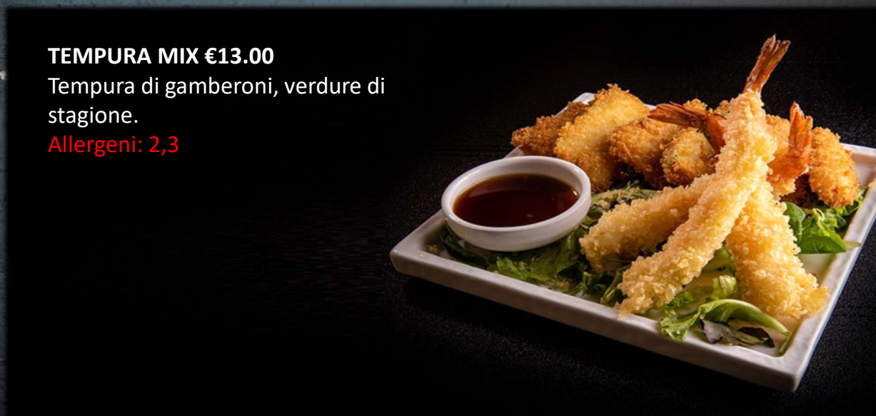
TEMPURA MIX €13.00 Tempura di gamberoni, verdure di stagione. Allergeni: 2,3