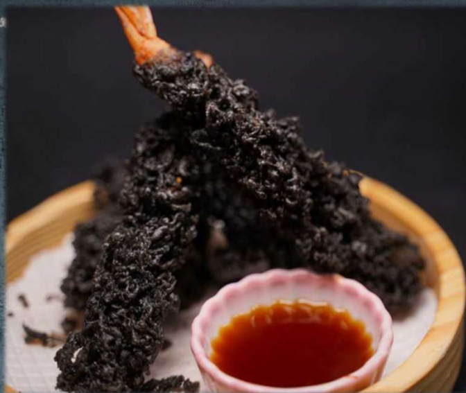
TEMPURA NOIR €16.00 Tempura mista in pastella nera. Allergeni: 2,3,7