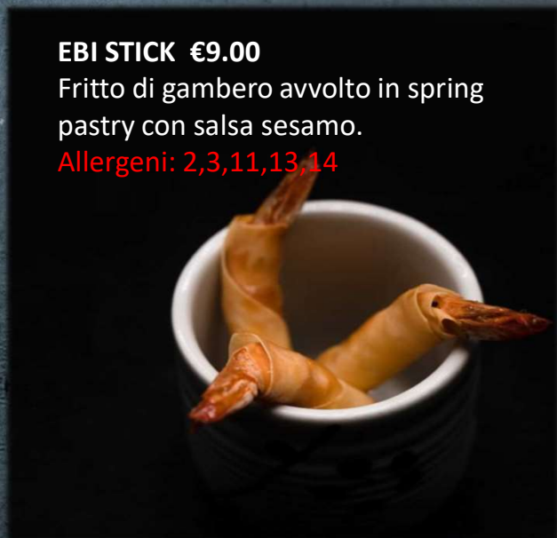
EBI STICK €9.00 Fritto di gambero avvolto in spring pastry con salsa sesamo. Allergeni: 2,3,11,13,14