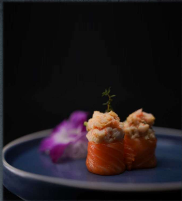
G. FLOWERS EBI €5.00 Ebi light e salmone all'esterno. Allergeni: 3,9,14