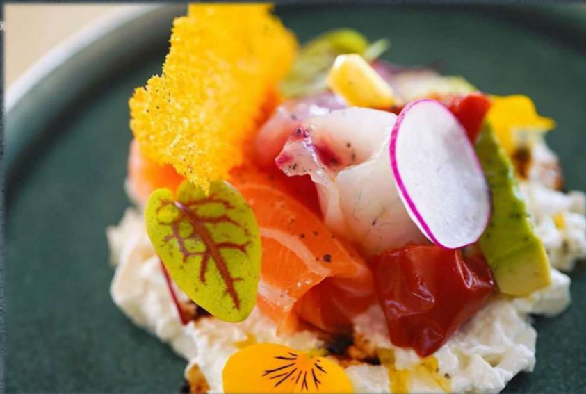
SASHIMI BURRATA €18.00 Sashimi misto con burrata, pomodori, aceto balsamico, sale nero ed olio e.v.o. Allergeni: 3,5,9,13