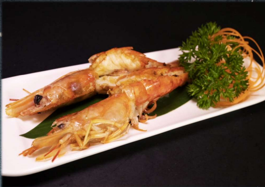
EBI YAKI €12.00 Gamberoni alla griglia. Allergeni: 3