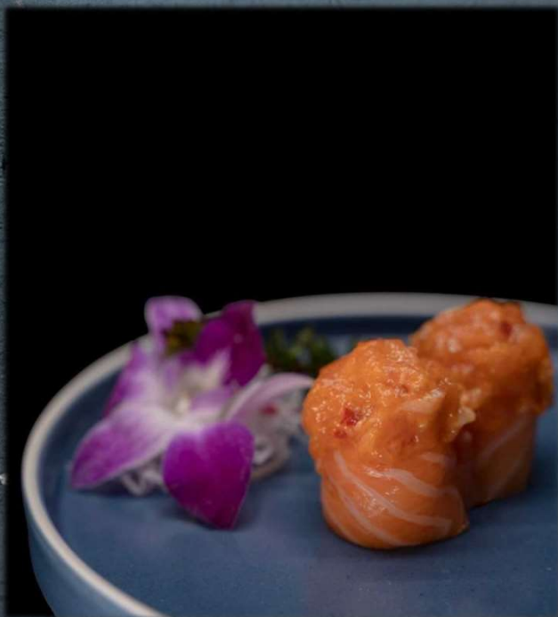
G. FLOWERS €5.00 Spicy salmon e salmone all'esterno. Allergeni: 9,14,15