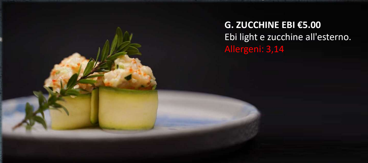
G. ZUCCHINE EBI €5.00 Ebi light e zucchini all'esterno. Allergeni: 3,14