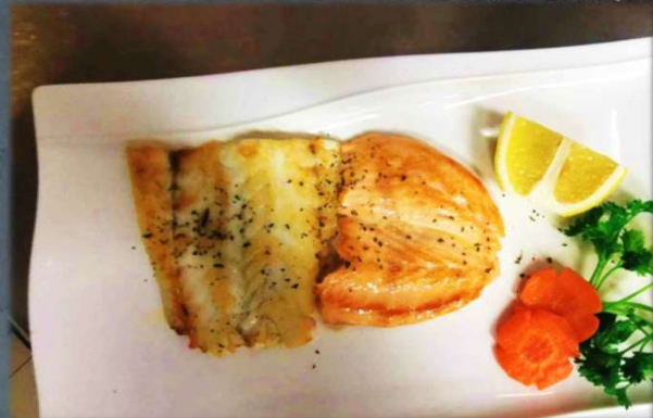
YAKI SAKANA €12.00 Pesce misto alla griglia. Allergeni: 3,7,9