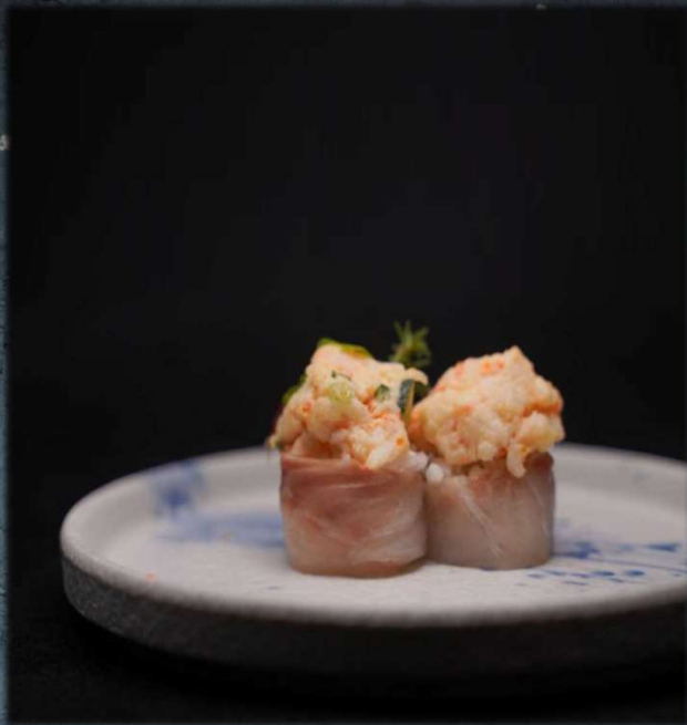
G. SUZUKI FLOWERS €5.00 Ebi light e branzino all'esterno. Allergeni: 3,9,14