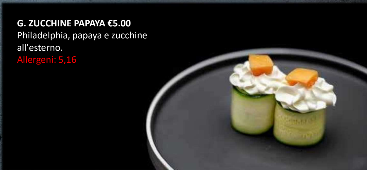
G. ZUCCHINE PAPAYA €5.00 Philadelphia, papaya e zucchini all'esterno. Allergeni: 5,16