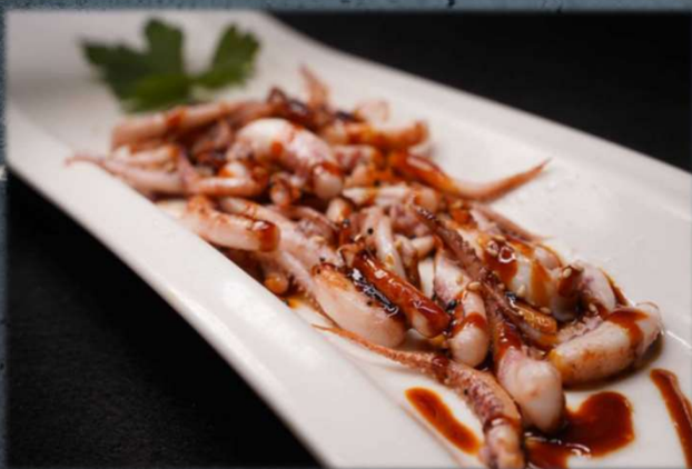
IKA YAKI €12.00 Ciuffi di calamari alla piastra con la salsa dello chef. Allergeni: 2,7,13