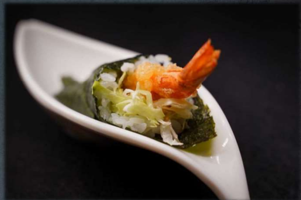
TEMAKI EBITEN €5.00 Gambero in tempura maki, insalata, mayo e salsa eel. Allergeni: 2,3,13,14