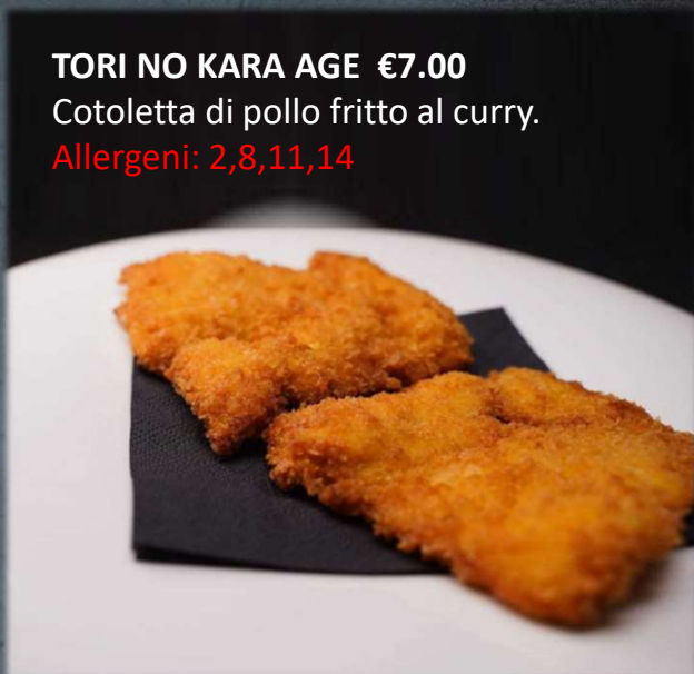
TORI NO KARA AGE €7.00 Cotoletta di pollo fritto al curry. Allergeni: 2,8,11,14