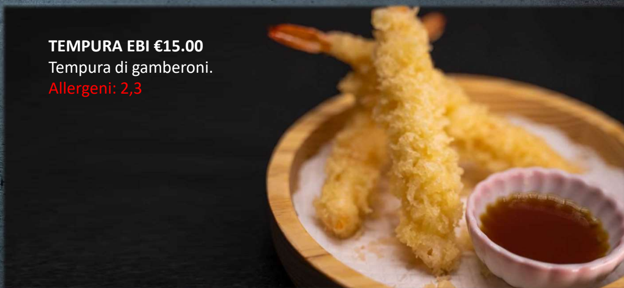
TEMPURA EBI €15.00 Tempura di gamberoni. Allergeni: 2,3