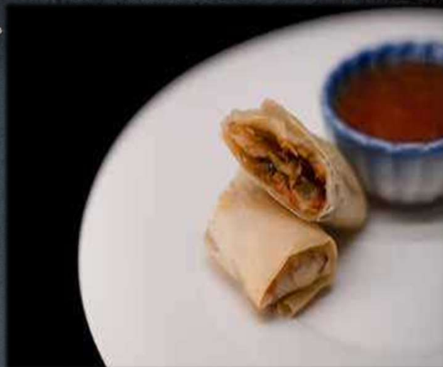
YASAI MAKI €6.00 Involtino fritto ripieno di verdure di stagione Allergeni: 2,16