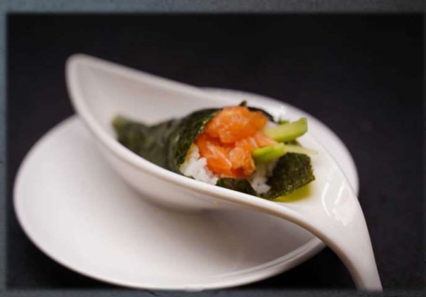
TEMAKI SPICY SALMON €5.00 Salmone tritato, cetriolo, tobiko e tabasco. Allergeni: 9,14,15