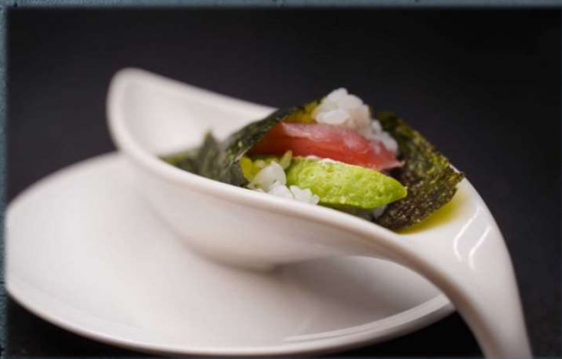
TEMAKI MAGURO €5.00 Tonno, avocado e philadelphia. Allergeni: 5,9