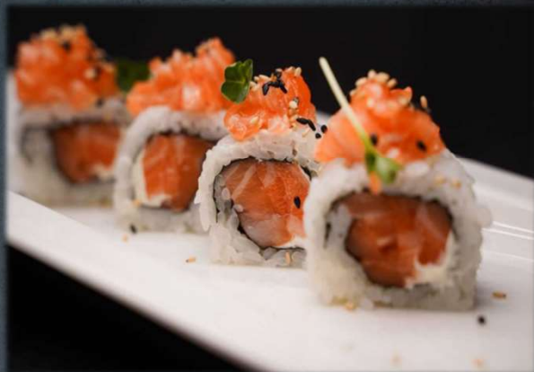
U. DOUBLE SALMON €6.00 Salmone, philadelphia, salmone e sesamo.