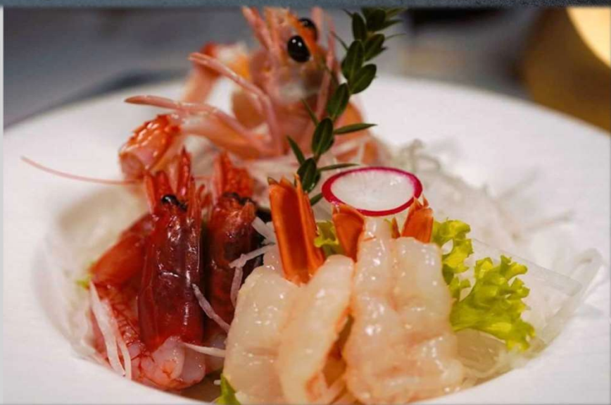
SASHIMI EBI €18.00 Sashimi di gambero misto. Allergeni: 3