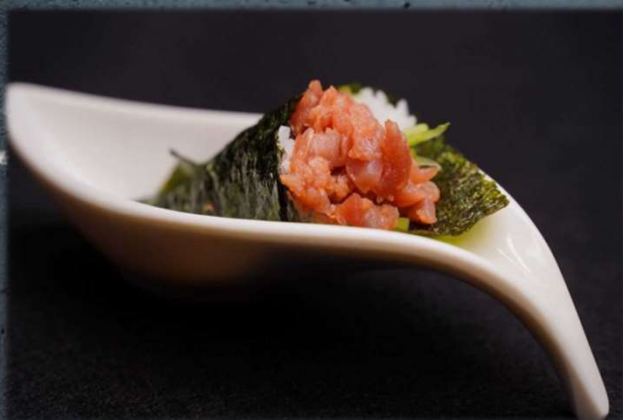
TEMAKI SPICY TUNA €5.00 Tonno tritato, cetriolo, tobiko e tabasco. Allergeni: 9,14,15