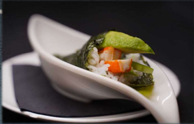
TEMAKI CALIFORNIA €5.00 Surimi, cetriolo, avocado e mayo. Allergeni: 2,3,13,14