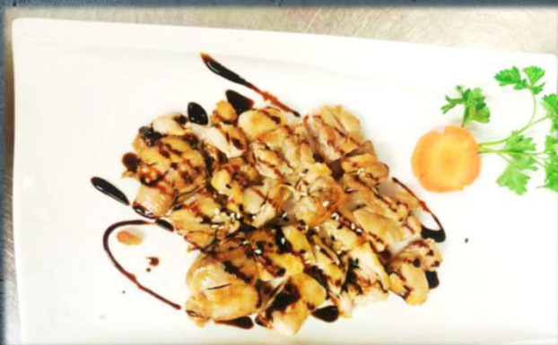
TORI YAKI €8.00 Pollo alla piastra con salsa teriyaki. Allergeni: 2,11,13