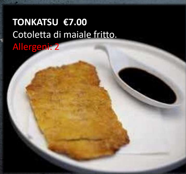
TONKATSU €7.00 Cotoletta di maiale fritto. Allergeni: 2