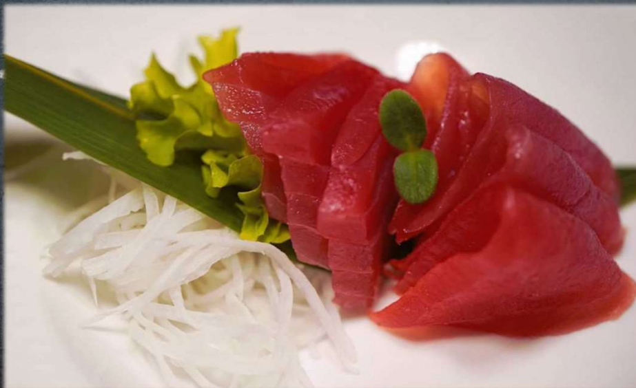
SASHIMI MAGURO €17.00 Fette di sashimi tonno. Allergeni: 9